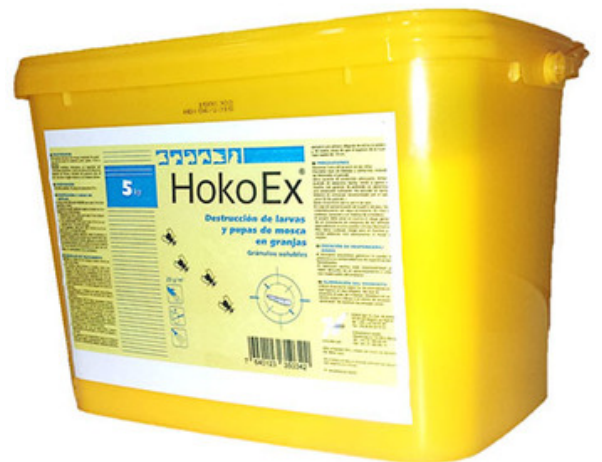
Cubo de 5kg